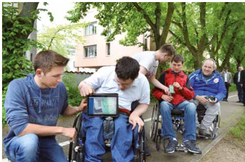
Studenti durante i test - Studenten beim Testen